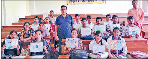
महेंद्रगढ़। बनाए हुए पोस्टर दिखाते विद्यार्थी।