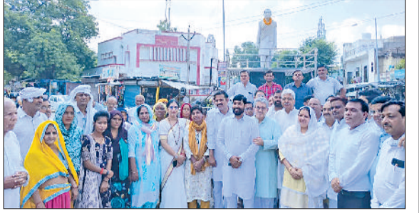
नारनौल। राजीव गांधी के श्रद्धासुमन अर्पित करते कांग्रेसी नेता। राजीव गांधी के श्रद्धासुमन अर्पित करते कांग्रेसी नेता।