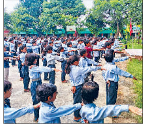
अटेली। नशे से दूर रहने की शपथ दिलाते हुए।