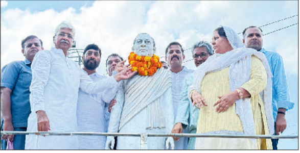
नारनौल। राजीव गांधी के श्रद्धासुमन अर्पित करते कांग्रेसी नेता। राजीव गांधी के श्रद्धासुमन अर्पित करते कांग्रेसी नेता।