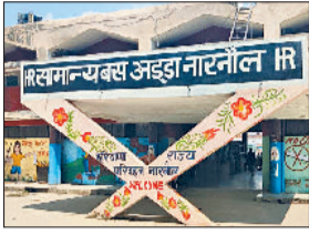
बस स्टैंड नारनौल।

बढोतरी के आदेश जारी किए थे। हरियाणा रोडवेज की बस में राजस्थान की सीमा तक पहले की तरह किराए दर लागू रहेगी। जैसे ही हरियाणा रोडवेज राजस्थान में प्रवेश करेगी, साधारण बस में प्रति किलोमीटर एक रुपये किराया बढ़ जाएगा। वहीं यात्रियों को राजस्थान से वापस आते समय प्रति किलोमीटर एक रुपये के हिसाब से