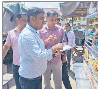
नारनौल। चालान करती नय टीम व अतिक्रमण हटवाती नय टीम।

सड़क पर अतिक्रमण किया हुआ है। अतिक्रमण के चलते इस मार्ग पर दिनभर जाम की स्थिति बनी रहती है। जिससे वाहन चालकों को भारी परेशानी उठानी पड़ती है। इसके अलावा बस स्टैंड के समीप