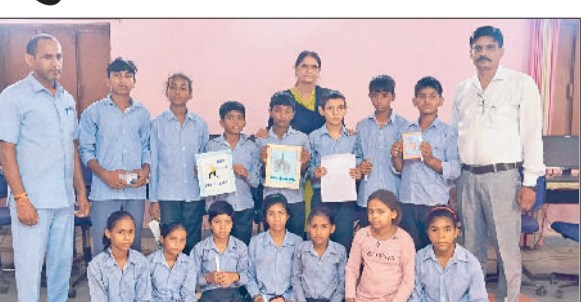
नारनौल। कार्यक्रम के दौरान विद्यार्थी व स्टाफ।

विषय पर रैली व पेंटिंग प्रतियोगिता आयोजित की गई। नांगल द्यूं स्कूल प्रवक्ता एवं ब्रिगेड ऑफिसर