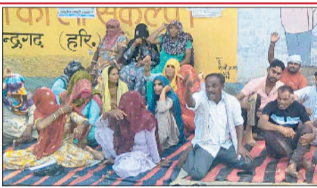
महेन्द्रगढ़। नगर पालिका कार्यालय में पार्श्व के खिलाफ नारेबाजी करते कर्मचारी।

पार्श्व ने बीती नौ अगस्त को दरोगा के साथ की सफाई कर्मचारी की बदली किए जाने को लेकर की थी बदसलूकी, शाम की शिफ्ट में काम पर लौटे कर्मचारी