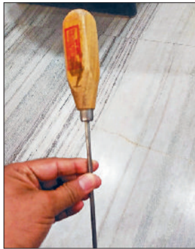
नारनौल। प्राचार्य रूम में रखा बर्फ तोड़ने में इस्तेमाल होने वाला नुकीला सुआ व इस दीवार को फांदकर भागे बदमाश व खराब पड़े सीसीटीवी।

पीजी कॉलेज प्राचार्य का दावा, बाहर से आए बदमाशों के पास था यह हथियार, पुलिस को बताने पर भी नहीं ले गई सुआ