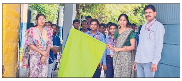
महेंद्रगढ़। कार्यक्रम में उपस्थित अतिथि।