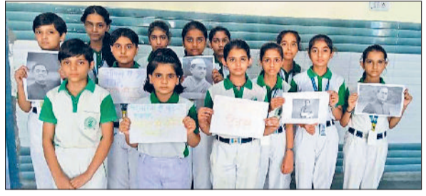
महेंद्रगढ़। बनाए हुए चित्र दिखाते विद्यार्थी।