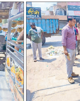
दुकानदारों की ओर से किए गए अतिक्रमण के चलते बसों को बस स्टैंड में प्रवेश करने परेशानी होती है। कई बार हादसा होने की भी आशंका बनी रहती है। नप की ओर से समय-समय पर इस मार्ग पर

सड़क पर अतिक्रमण किया हुआ है। अतिक्रमण के चलते इस मार्ग पर दिनभर जाम की स्थिति बनी रहती है। जिससे वाहन चालकों को भारी परेशानी उठानी पड़ती है। इसके अलावा बस स्टैंड के समीप